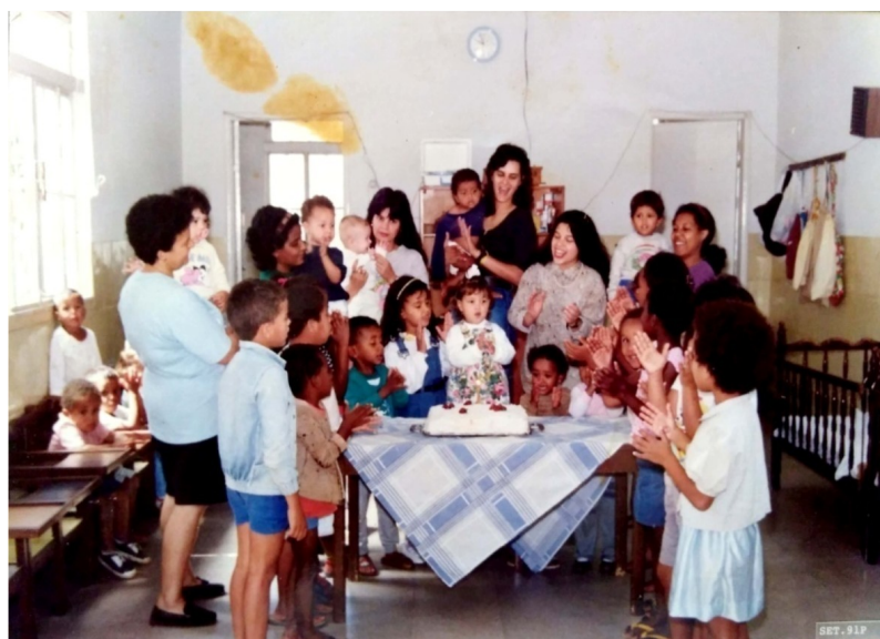
Figura 4: aniversário na Creche ABC.

Como um marcador da minha história, a creche ABC fez parte de minha iniciação na escola, tendo sido igualmente palco de celebração de um aniversário dos meus primeiros anos de vida.