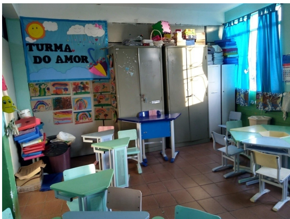
Figura 10: Imagem da sala de aula do segundo período da professora Júlia.