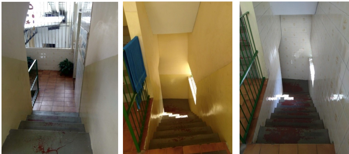
Figura 9: Hall de entrada da “Turma do Amor”.