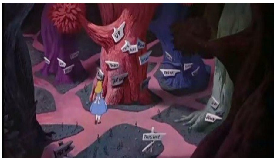
Figura 12: Cena do filme Alice no País das Maravilhas.