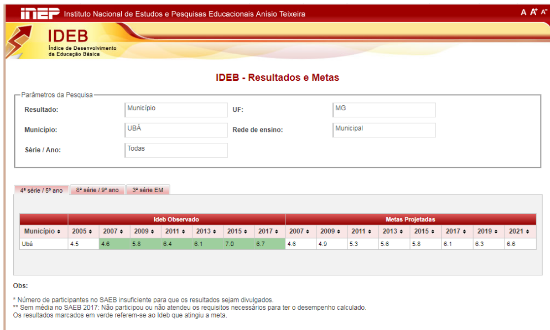
Figura 2: Print da página do Inep com os resultados e metas do 5º ano do município de Ubá-MG.

primeiro é atingir a nota 6.1 e, para o segundo, a nota 4.8, como ilustradas nas imagens a seguir 18 .